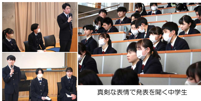
真剣な表情で発表を聞く中学生

私は今日、自分に必要なことに気付くことができました。一つ目は勉強についてです。高校生の話を聞くと、中学校の時勉強していなかったことを後悔している人がいました。もう中学校は卒業してしまうけれど、高校入学までに中学校の勉強を偏りなく復習したいと思います。