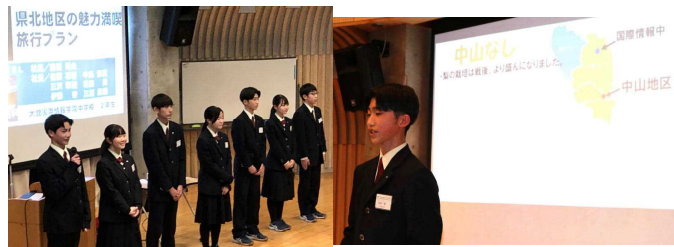
2年生代表チームは、県北地区の様々な素材を取り上げて、旅行プランを作成してみました。

9日、初の試みとして、県内3中学校合同の総合的な学習の時間の発表会が行われました。各校の代表生徒が、探究の成果についてon-lineで紹介し合うものでした。KJ中からは、2年生が県北地区の観光モデルプランを、3年生が日本と台湾の教育の違いについて発表しました。2年生は発表をオールイングリッシュで行い、3年生は海外修学旅行で得た見識について語るなど、本校の特長を十分に発揮するものでした。